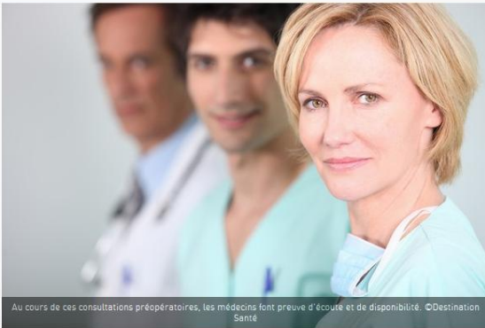
Au cours de ces consultations préopératoires, les médecins font preuve d'écoute et de disponibilité.

Avec un IMC supérieur à 40, les 550 000 Français atteints d'obésité morbide peuvent bénéficier de la chirurgie bariatrique. Lorsqu'ils présentent au moins deux complications liées à leur surpoids, les patients obèses ayant un IMC inférieur à 40 sont également éligibles à cette intervention. Cette technique chirurgicale consiste à diminuer le volume gastrique pour favoriser la satiété précoce. Et donc réduire les apports alimentaires. Objectifs, enclencher une perte de poids durable et limiter le risque de complications liées à l'obésité. Mais quelles sont les étapes avant d'entrer au bloc chirurgical ?